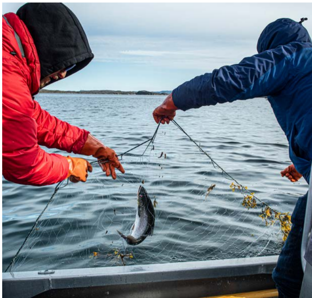
EU-p Kalaallit Nunaannut aalisarneq pillugu isumaqatigiissutaa maanna atuuttoq EU-p aalisarneq pillugu isumaqatigiissutaasa annersaata pingajuattut inissisimavoq.

Det er også en vigtig aftale i finansiel henseende, idet det er den tredjestørste fiskeriaftale, EU nogensinde har indgået.