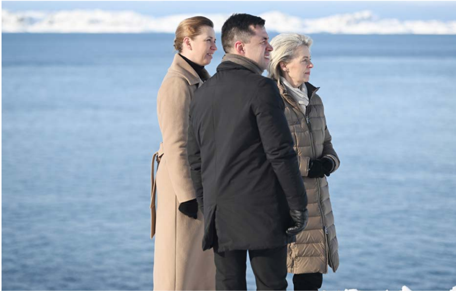
Mette Frederiksenip, Múte B. Egedep Ursula von der Leyenillu Nuup Kangerluanut isikkivik qimerluualaaraat.