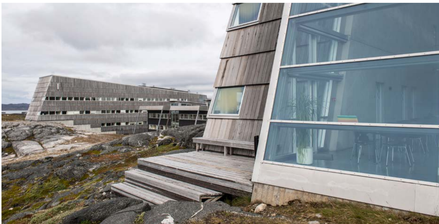
EU aalisarnermut isumaqatigiissut aqutigalugu Pinngortitaleriffiup aalisakkat amerlassusaannut nalilersuisarneranut tapiissuteqartarpoq.

På det videnskabelige område giver aftalen mulighed for at støtte forskellige tiltag, f.eks. forbedret rådgivning om bestandenes tilstand eller forskning og undersøgelser i grønlandske farvande. Disse tiltag kan gennemføres, fordi EU-aftalen indbefatter et finansielt bidrag til Grønlands Naturinstituts budget. Den videnskabelige støtte er et væsentligt element i sikringen af en bæredygtig udnyttelse af de fiskeressourcer, der er omfattet af fiskeriaftalen.