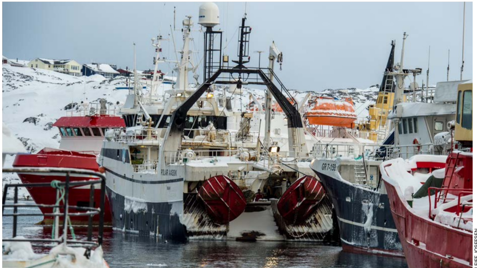
EU-p Kalaallit Nunaatalu aalisarneq pillugu politikki 1985-imiilli suleqatigiissutigaat.

Isumaqatigiissut pissutaalluni kilisaatit EU-meersut aqqaneq-marluk Kalaallit Nunaata imartaani saarullinnarsinnaapput, suluppaa-garniarsinnaapput, qaleralinnarsinnaapput, raajarniarsinnaapput, ammassassuarniarsinnaapput ammassassuarnillu pisaqarsinnaallutik. Avaleraasartuut isumaqatigiissumi aamma ilaapput, ilisimatuussutsikkulli aalisagartassiissutitut inner-