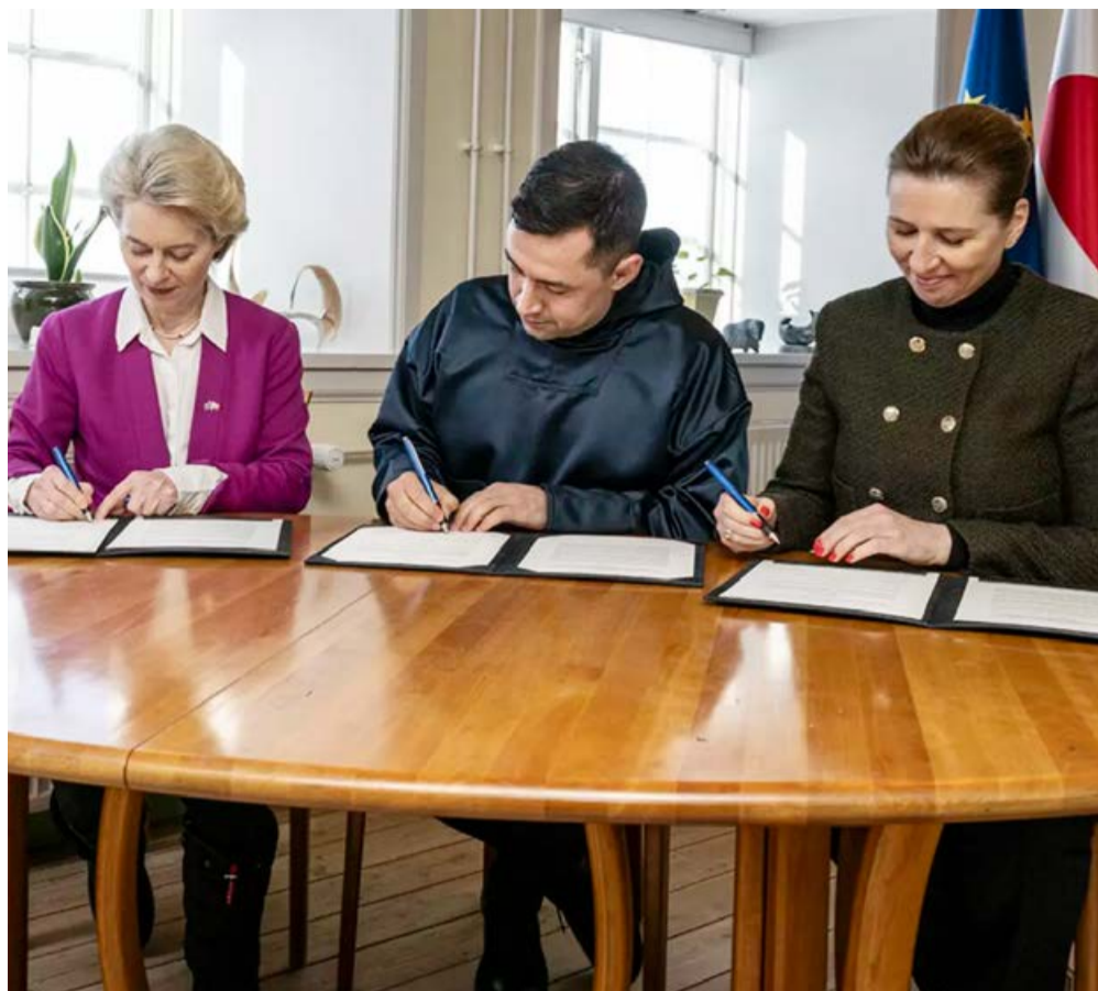
EU-p Kalaallit Nunaatalu suleqatiginnerat annerulersinniarlugu Nuummi Hans Egedep Illuani atsioqatigiinneq.

– Vores Mission her i Bruxelles repræsenterer, fremmer og forsvaret Naalakkersuisuts interesser og fokusområder overfor en række europæiske institutioner og samarbejder med