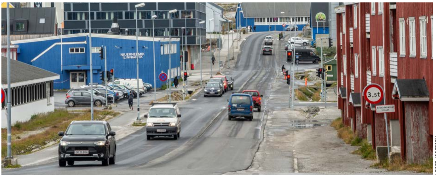
Kalaallit Nunaat iluliaqarfimnaanngitsoq nannunillu ulikkaanngitsoq, nunanit allaneersut Ilisimatusarfimmi ilinniartut paasisarpaat.

– Ilinniartut tamaasa nunanut allanut angalaqqullugit kajumissarusuppakka – soorlu paarlaateqatigiinnermut, taamaallitut ilinniakkatik unitsinngikkaluarlugit nunat allamiut kulturiilu allat takusinnaasavaat. Uangattaq nuannaarutit annikitsunnguit pingaartinnissaat