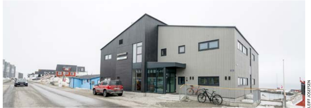
EU-p allaffittaava Nuup qeqqani Inatsisartut Naalackersuisullu saanniippoq.

– EU Kalaallit Nunaanni anner-tuumik akuulereerpoq. Aalisar-